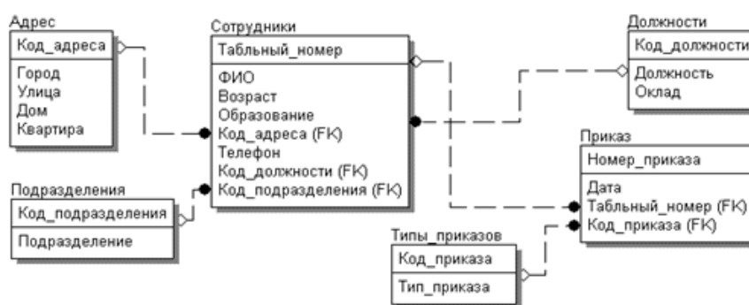
Рис.1. Логическая модель данных

Задача 2. На рисунке 1 представлена логическая модель данных. Поясните – в какой среде она построена? Что на ней представлено?